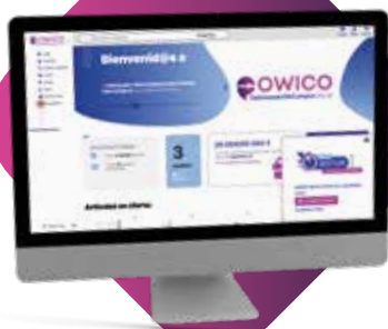
Un panel amigable